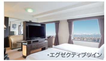
・エグゼクティブツイン