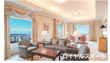
・ロイヤルスイート