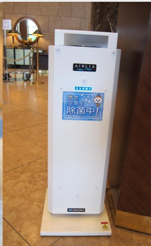
空気循環式紫外線清浄機