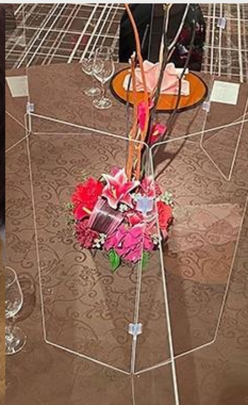
円卓用飛沫防止パーテーション

「ホテルオリジナル 手に取るマスク」は、お客様ご自身の感染防止と、ご同席される相手へのさりげない気遣いとともに、飲食時の会話を楽しむことができます。