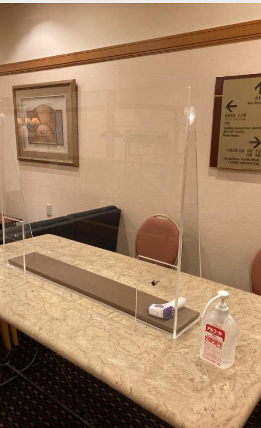
受付スペース用に飛沫防止パーテーション、消毒液、検温器の準備