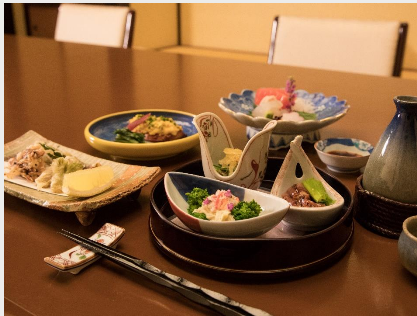
5F 日本料理 雲海