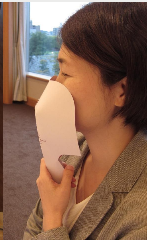
飲食時の飛沫防止策アイテム

「ホテルオリジナル 手に取るマスク」は、お客様ご自身の感染防止と、ご同席される相手へのさりげない気遣いとともに、飲食時の会話を楽しむことができます。