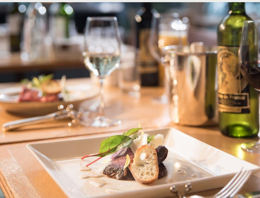
1F カフェ・イン・ザ・パーク