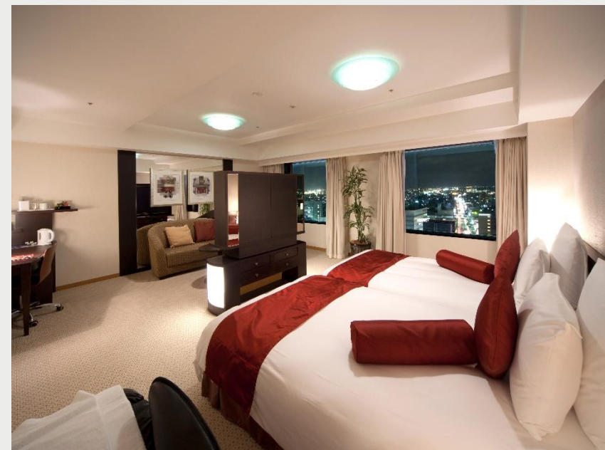
プレミアムフロア エグゼクティブツイン(40㎡)