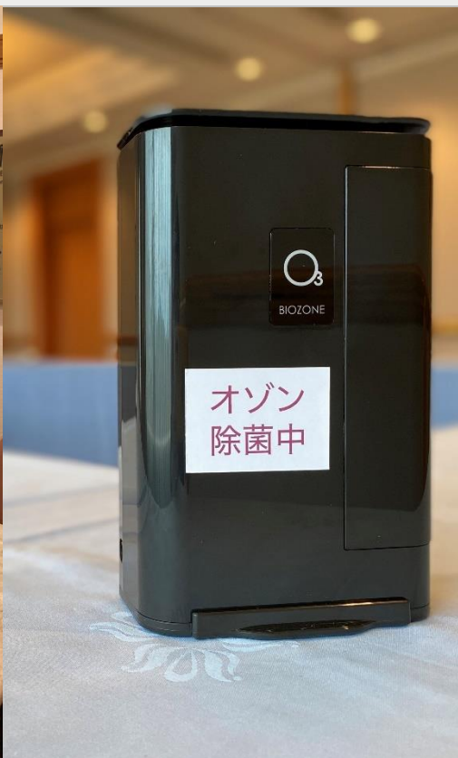
オゾン発生器 BIOZONE AIR