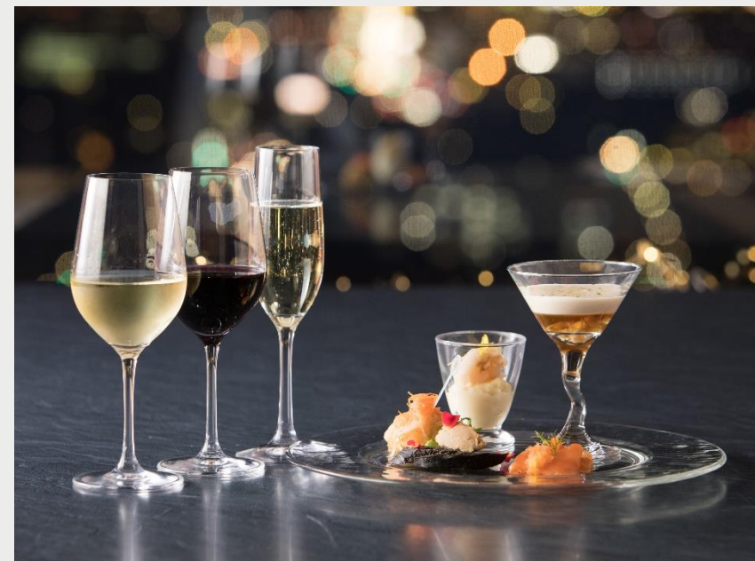
19F スカイバー アストラル