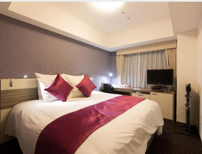
レギュラーフロア スタンダードダブル(20㎡)